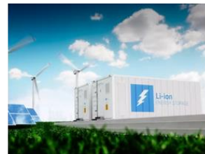
Sistemas de almacenamiento

Partiendo del negocio solar, donde hemos adquirido nuestra experiencia, nuestro crecimiento y madurez nos han permitido definir una estrategia orientada a la diversificación del negocio, ampliando el espectro de tecnologías para operar con igual eficiencia en la energía eólica y atendiendo también a otras soluciones como la demanda de almacenamiento o los sistemas híbridos.